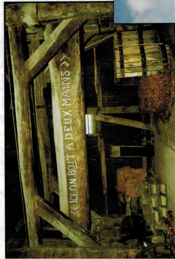
Pressoir à abattage