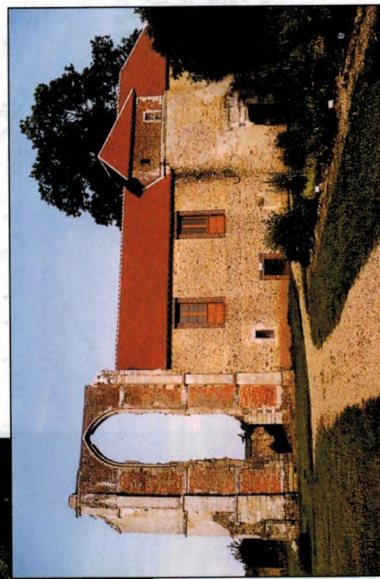
Prieuré de l'Enfourchure acquis en 1993 par les Amis du Patrimoine du Pays d'Othe