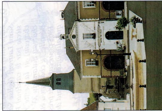
Cerisiers Place de l'Hôtel de Ville et l'église St-Jean-Baptiste