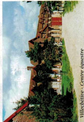
Villechétive - Centre équestre