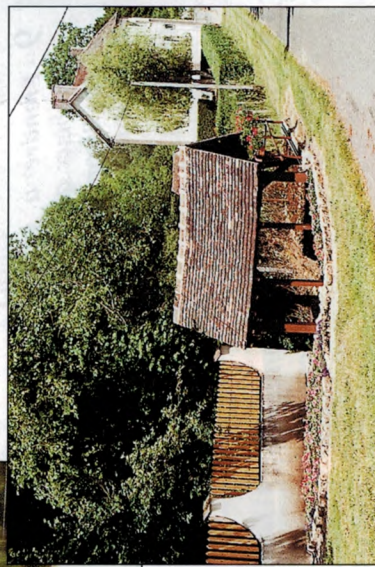
Dilo L'ancienne Mairie et le lavoir.