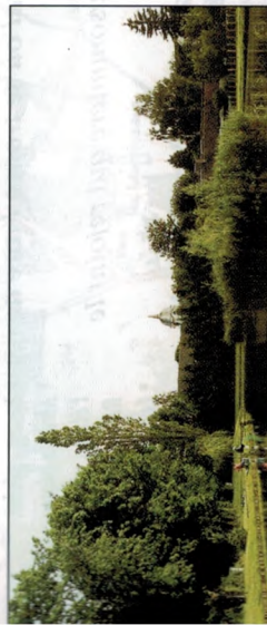
Arces - L'étang du Moulin et l'église St-Michel en arrière plan.